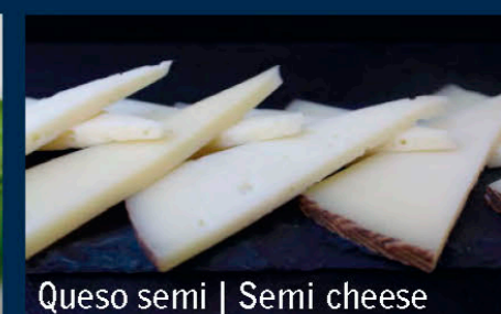
Queso semi | Semi cheese