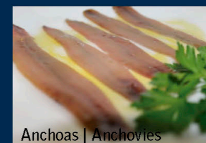
Anchoas | Anchovies