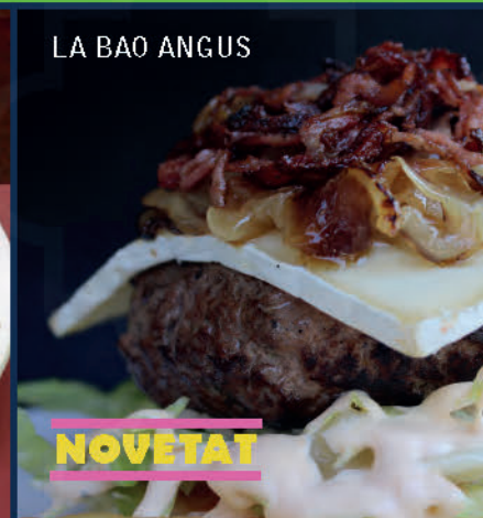
LA BAO ANGUS