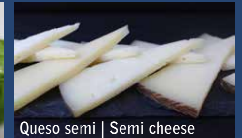
Queso semi | Semi cheese