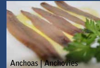
Anchoas | Anchovies